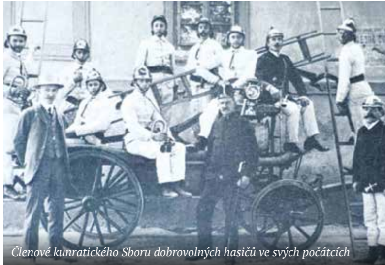
Členové kunratického Sboru dobrovolných hasičů ve svých počátcích

V roce 1910 se konalo velké cvičení, kam přijely i sbory odjinud. Simulovaný požár v domě u Šimáček krotilo tak hned několik hasičských jednotek. Hasiči divákům před-